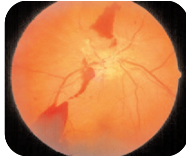
Rétinopathie diabétique proliférante